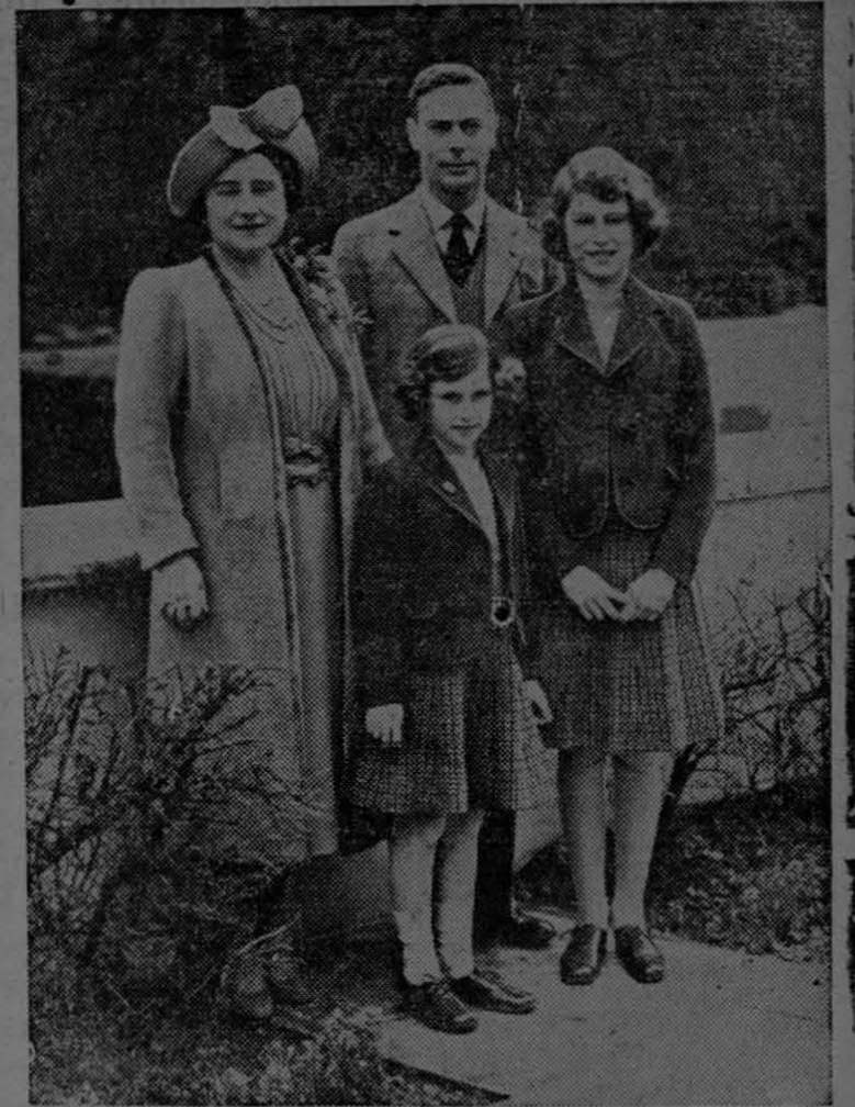
Quienes deseando mantener la paz de la humanidad hacen todo esfuerzo para evitar la guerra.