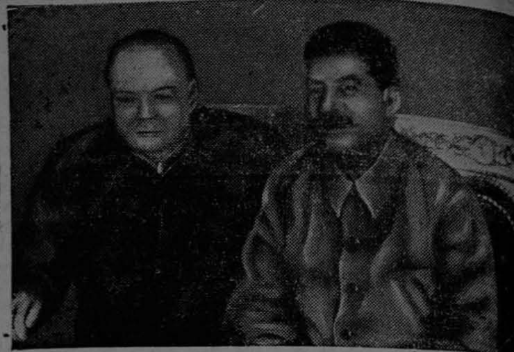
De quienes depende hoy la paz, o la Tercera Guerra Mundial.

De los escarmentados se hacen los avisados.